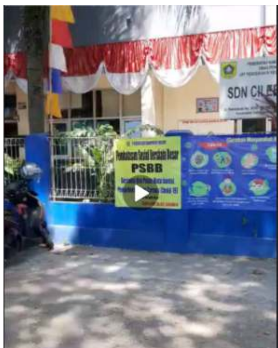
Gambar 2: Halaman depan sekolah