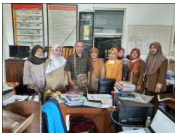
Gambar 3: Kantor ruang guru